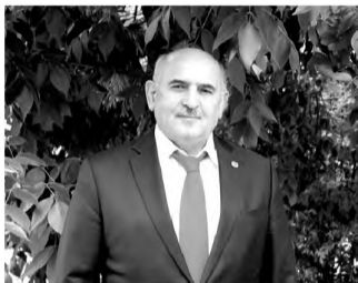
Гъудул – гъалмагъабазул къокъа.

Баркула Юкрудинида тIадегIа-наб ва мустахIикъаб шапакъат.