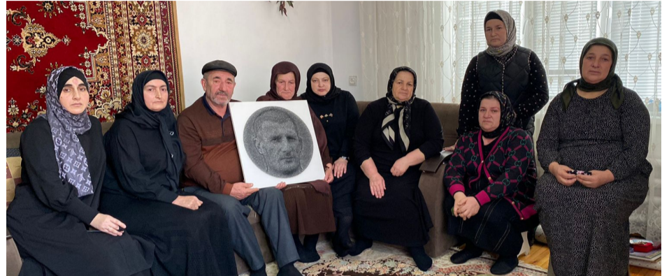
ДандчIаваязул ахиралда А. Абужанатовалъ Расулилги Муслимилги хъизабазе гъезул рагъухъабазул квералъ рахъарал суратал сайгъат гъаруна.