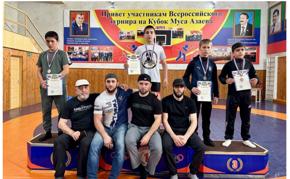
лалтур рахъалдасан, грамотабаздальун ва медалаздальун кюдо гъаруна.

Призалулаб баклал росарал глсинал гугарухъаби, М.Пазаевасул спортшко-